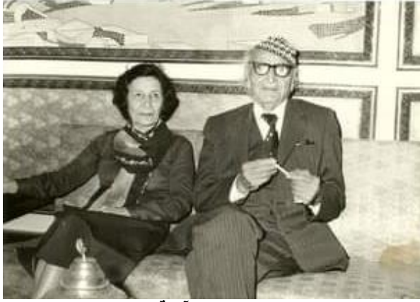
الجواهري مع زوجته آمنة الجواهري

في عام 1938 يسافر الى مصر ضمن وفد طبي عراقي لكن وهو في بيروت يتلقى خبر وفاة زوجته مناهل فيعود الى العراق. وقد الف قصيدة رائعة مليئة بالعواطف بمناسبة وفاتها. بعد عام من ذلك يتزوج من اخت مناهل (آمنة) وينجب منها ثلاثة اولاد (نجاح و خيال و ظلال). بقيت زوجته هذه معه مدة 53 عاما في السراء والضراء مرتحلا من بلد الى آخر حتى توفيت في لندن عام 1992. في عام 1941 اثناء الاضطرابات التي رافقت حركة رشيد عالي الكيلاني يلجأ الشاعر مع عائلته الى ايران فيبقى هناك لمدة ثم يسافر الى لبنان ويشترك في احتفالية بمناسبة ذكرى ابو علاء المعري وينشد قصيدة في جمال و روعة لبنان: